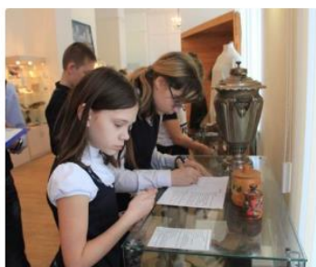
Интерактивные квесты для школьников