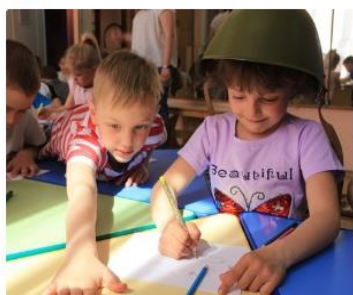
Музейно-педагогическое занятие «Военными тропами»

В экспозиции «История Заельцовского района» вы увидите экспонаты кон. XIX — нач. XX века, узнаете информацию о первых градообразующих предприятиях, комбинатах и фабриках, о развитии медицины и образования в Заельцовском районе. Познакомьтесь с материалами, посвященными Великой Отечественной войне, а также с интересными комнатами и интерактивными фотозонами, отражающими быт советского гражданина.