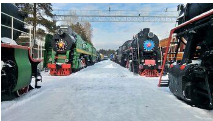
Музей железнодорожной техники

Позвольте ребенку окунуться в мир космоса, узнать о других планетах, увидеть мириады звезд в планетарии Новосибирска . Фильмы о космосе показывают в Звездном зале, законы физики демонстрируются в музее науки «Марс-2003», наблюдения за небесными светилами проводятся в обсерватории планетария. Экскурсия получится увлекательной и познавательной.