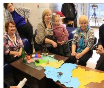
Познавательная игра «Мы — одна команда! Мы – одна страна!»

Адрес: Красный проспект, 179, 1 этаж (ост. «Северная»)