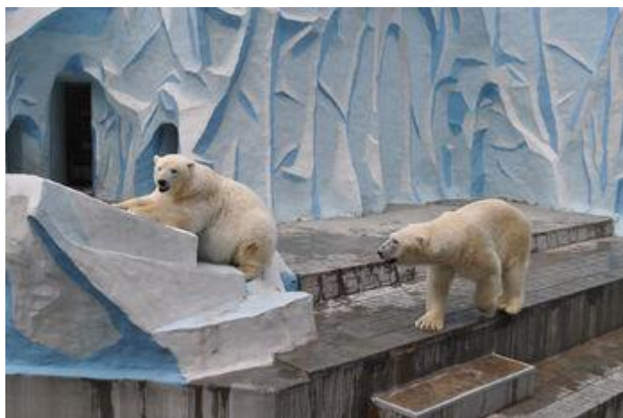
Новосибирский зоопарк

В классический набор развлечений для детей в Новосибирске входит цирк, зоопарк, планетарий, аквапарк и парк развлечений на выбор. Детские игровые площадки сейчас есть почти в каждом торговом центре и во многих семейных кафе. Культурная программа выходного дня не обойдется без посещения детских театров и музеев Новосибирска.